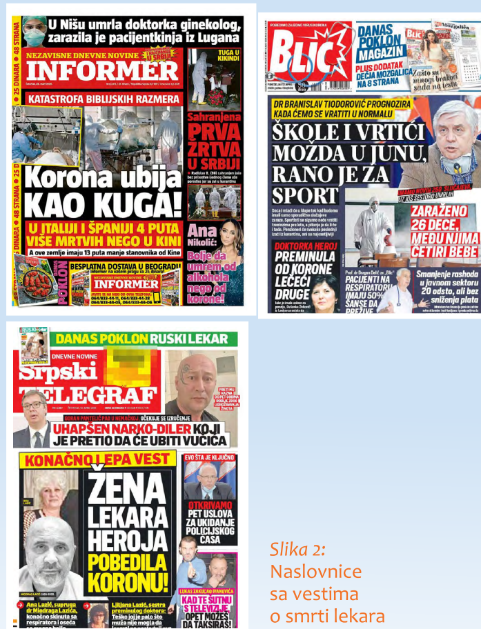
Slika 2: Naslovnice sa vestima o smrti lekara

neproverene informacije, da ne detaljišu o pridruženim bolestima, da ne spekulišu o kontaktima i putevima zaražavanja i da se potrudu da familijama ne zadaju dodatnu bol svojim izveštavanjem. I dok je deo medija odista odmereno izveštavao o medicinskim radnicima, deo je podilazio interesovanju javnosti nudeći lične priče i fotografije, posebno na svojim naslovnim stranama (Slika 2).