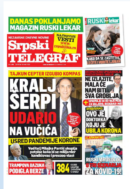
Slika 1: Naslovna strana Srpskog telegrafa (26. mart 2020)

diji izvestili da je u KC Niš preminula doktorica, potom je za RTS ovu informaciju potvrdio i ministar zdravlja. Na konferenciji za novinare kriznog štaba navedeno je da je preminula „B. Lj. (59) iz Prokuplja“, a pojedinosti o oboljevanju izneo je Zoran Radovanović, direktor KC Niš. Neki mediji koristili su inicijale da zaštiti identitet preminule doktorke, dok su drugi, poput Informera, odmah je objavili njeno ime i prezime. 16 Već sutradan naslovna strana Srpskog telegrafa donosi vest „Otkrivamo: Ovo je doktorica koju je ubila korona“ uz prapatnu fotografiju (Slika 1). Iz teksta je jasno da su novinari želeli da prošire priču, pa tako prenose reči jednog od, čini se nevoljnih, sagovornika: „Jeste, radila je kod nas i bila je izuzetan lekar. To je sve što mogu da vam kažem. Razumite nas - rekao je za Srpski telegraf direktor DZ u Nišu Milorad Jerkan“. 17 Dok su u većini medija navedeni osnovni biografski podaci, portal Telegraf u svom tekstu je koristio neimenovani izvor, koji iznosi niz spekulacija: „Imala je temperaturu i sa njom radila pet dana. Nije prijavila da je bila u kontaktu sa ženom od koje se većina zarazila - kaže naš izvor i dodaje da je B. Lj. imala dijabetes“. 18 Ovakvo izveštavanje je problematično ne samo iz ugla zaštite privatnosti, već predstavlja opasne i neproverene pretpostavke o kretanju virusa i ponašanju preminule lekarke.