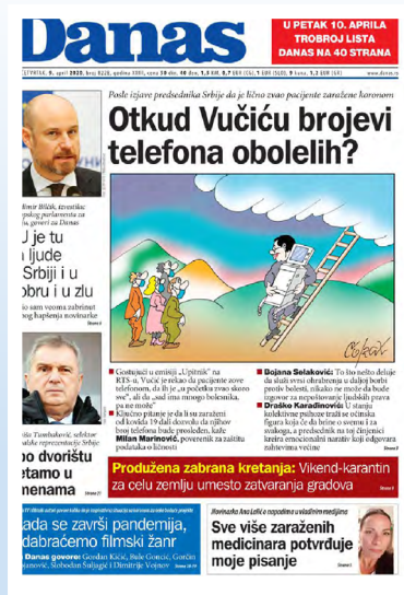
Slika 3: Naslovna strana Danasa (9. april 2020)

Neke druge teme ostale su bezmalo u celosti bez javne rasprave. Recimo, baveći se povratkom ljudi iz inostranstva u Srbiju i naglašavajući kako se proverava da li poštuju mere samoizolacije, predsednik Srbije Aleksandar Vučić je u jednom od obraćanja na konferenciji za novinare kriznog štaba nagovestio da se prate geolokacije telefona. Ovo je mera kojoj su pojedine države pribegle u suzbijanju pandemije, ali nije bilo zvaničnog obaveštenja da je ovo postupanje uvedeno u Srbiji. Na ovu temu osvrnuo se samo list Danas, 43 naglašavajući da je nejasno po kom pravnom osnovu država prati telefone građana.