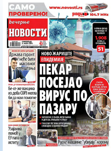
Slika 4: Naslovna strana Večernjih novosti (6. april 2020)

grafiju. Koristeći puno ime i prezime sveštenika, Večernje novosti objavljuju vest „Sveštenik iz Konjica nekoliko dana u samoizolaciji, bio u kontaktu sa direktorom „Slobode“ iz Čačka“. 48 U opsežnu potragu za kontaktima mediji kreću i povodom prvog zaražavanja u Novom Pazaru. Vest da se radi o pekaru, ali bez navođenja imena, objavljuju mnoge redakcije, 49 a Večernje novosti ponovo prednjače, objavljujući na naslovnoj strani sliku pekara na osnovu koje se lako može utvrditi identitet zaraženog (Slika 4). Kurir i Novosti bave se