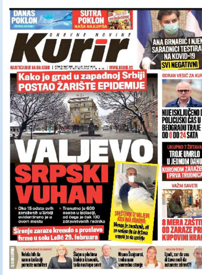
Slika 5: Naslovnice o zdravstvenom stanju i smrti sveštenih lica