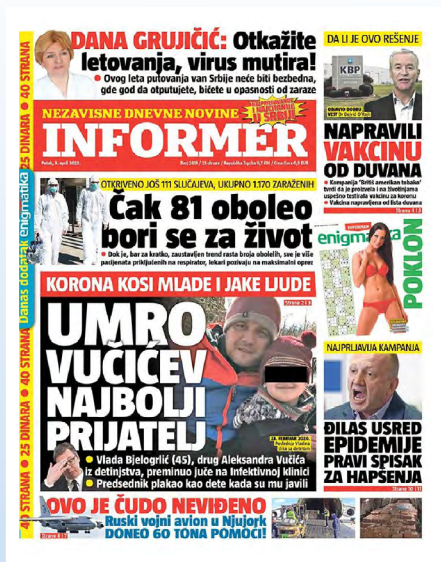
Slika 6: Naslovna strana Informera (3. april 2020)

Drugi slučaj izveštavanja odnosi se na Vučićevog starijeg sina. Informacija je potekla od samog predsednika, koji se oglašio sa svog zvaničnog Fejsbuk naloga. Informaciju su preneli bezmalo svi mediji, što je u redu prema „Smernicama za primenu Etičkog kodeksa novinara Srbije u onlajn okruženju“, 59 pošto za javne ličnosti, posebno za javne funkcionere, saglasnost za objavljivanje objave sa društvenim mreža nije obavezna. Vesti o predsednikovom sinu dalje su perpetuirane izjavama podrške koju su vlada i njeni ministri upućivali predsedniku i njegovom sinu, ali nisu