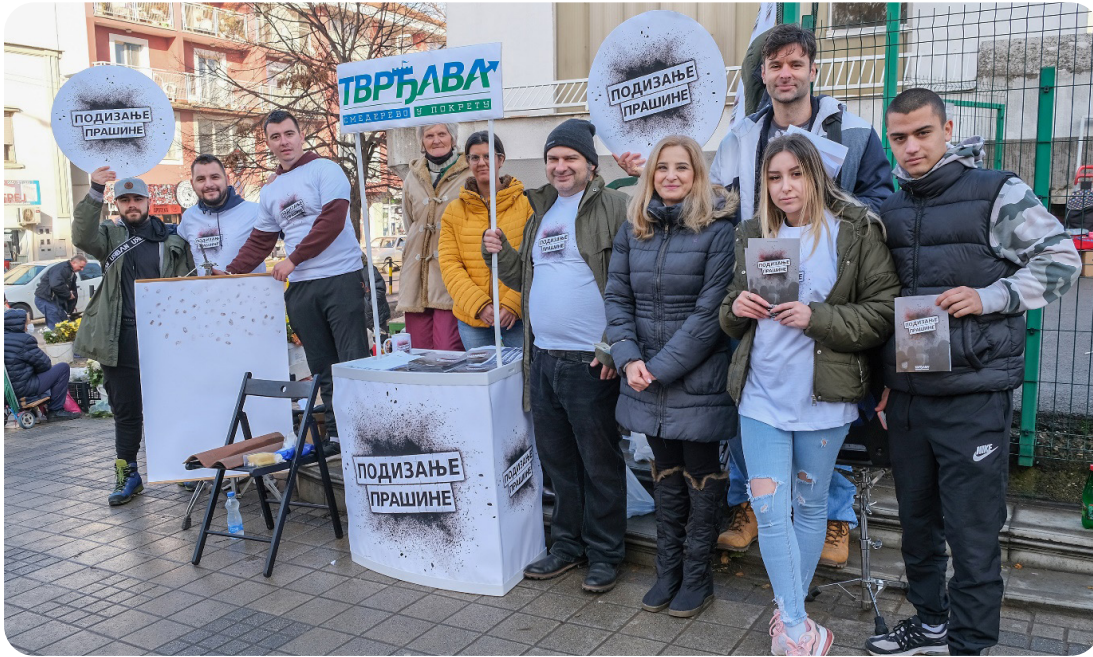
Kampanja „Podizanje prašine“ – Građani imaju moć